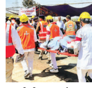
हरिभूमि न्यूज़ | भोपाल