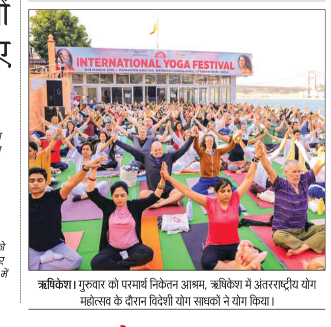
ऋषिकेश। गुरुवार को परमार्थ निकेतन आश्रम, ऋषिकेश में अंतरराष्ट्रीय योग महोत्सव के दौरान विदेशी योग साधकों ने योग किया।