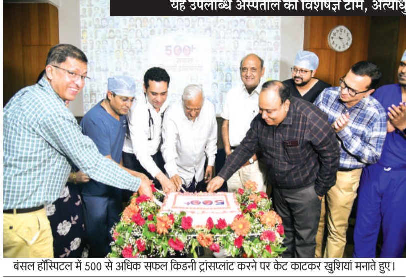
बंसल हॉस्पिटल में 500 से अधिक सफल किडनी ट्रांसप्लांट करने पर केट काटकर खुशियां मनाते हुए।

बंसल सुपर स्पेशलिटी हॉस्पिटल, भोपाल ने किडनी ट्रांसप्लांट के क्षेत्र में एक महत्वपूर्ण उपलब्धि हासिल करते हुए 500 से अधिक सफल किडनी ट्रांसप्लांट पूरे कर लिए हैं। यह उपलब्धि अस्पताल की विशेषज्ञ टीम, अत्याधुनिक तकनीक और मरीजों के विश्वास का परिणाम है। इन ट्रांसप्लांट्स में एबीओ इनकम्पैटिबल ट्रांसप्लांट (जब डोनर और रिसीवर का ब्लड ग्रुप मेल नहीं खाता), स्वेप ट्रांसप्लांट, पीडियाट्रिक ट्रांसप्लांट और कैडेवर ट्रांसप्लांट (ब्रेन डेड डोनर से) जैसी जटिल प्रक्रियाएं शामिल हैं। अस्पताल में अब तक 500+ किडनी ट्रांसप्लांट कर चुकी है इनमें मुख्य 70 से अधिक एबीओ इनकम्पैटिबल, 25 स्वेप, 20 कैडेवर और 7 पीडियाट्रिक किडनी ट्रांसप्लांट सफलतापूर्वक किए जा चुके हैं।