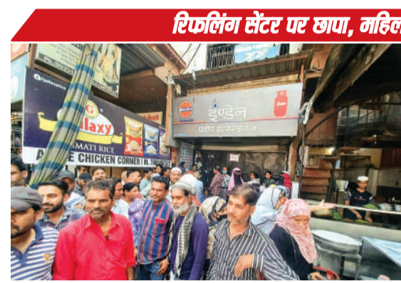
जिंसी की प्रदीप इंडेन गैस एजेंसी पर हंगामा करते लोग।

भारत, एचपी, इंडेन की बुकिंग फेल ब्लैक में मिल रहा 3 हजार में सिलेंडर