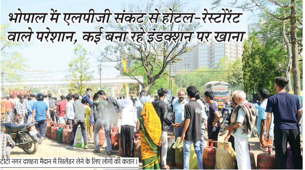
टीटी नगर दशहरा मैदान में सिलेंडर लेने के लिए लोगों की कतार।

सूत्रों के अनुसार ग्वालियर में रेलवे बेस किचन है। इसमें रेलवे के 3000 से अधिक यात्रियों के लिए रोजाना खाना बनाता है। यहां पर गैस की किल्लत का असर देखने को मिल रहा है। किचन से वंदे भारत एक्सप्रेस, राजधानी एक्सप्रेस, दुरंतो एक्सप्रेस, शताब्दी और तेजस एक्सप्रेस जैसी प्रीमियम ट्रेनों को खाना सप्लाई की जाती है। गैस की किल्लत की वजह से खाने के मेन्यू पर आने वाले दिनों में असर देखने को मिल सकता है। हालांकि रेलवे की ओर से इंडक्शन और माइक्रोवेव के इस्तेमाल पर जोर दिया है।