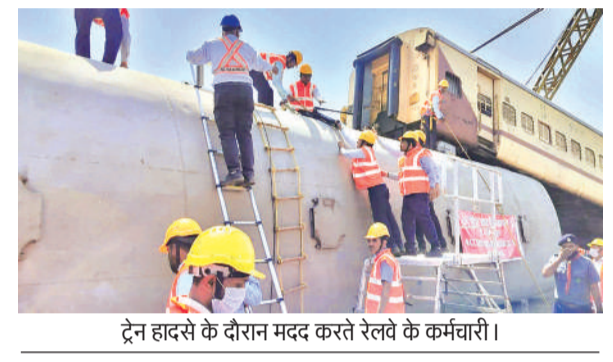
ट्रेन हादसे के दौरान मदद करते रेलवे के कर्मचारी।

रजिस्ट्री कराने के लिए पंद्रह हजार रुपए तक अधिक खर्च करना पड़ेंगे