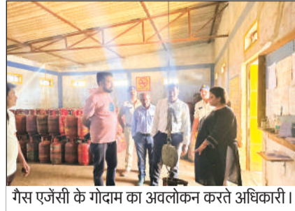
गैस एजेंसी के गोदाम का अवलोकन करते अधिकारी।