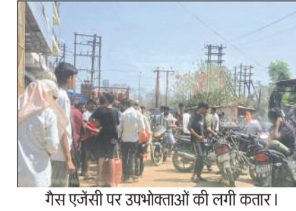
गैस एजेंसी पर उपभोक्ताओं की लगी कतार।

सुबह आठ बजे से उपभोक्ता लावा रहे लाइन में मंडीदीप में उपभोक्ताओं के द्वारा गैस न मिलने के अफवाह से सुबह से ही गैस एजेंसी में भीड़ देखने को मिल रही है। एजेंसी में सुबह 8 बजे से उपभोक्ता लाइन लगाकर कर खड़े हो जाते हैं। गैस उपभोक्ताओं का कहना है कि ऑनलाइन बुकिंग में सर्वर बंद होने से काफी दिक्कतों का सामना करना पड़ रहा है।