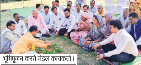
भूमिपूजन करते मंडल कार्यकर्ता।