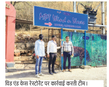
विंड एंड वेब रेस्टोरेंट पर कार्रवाई करती टीम।