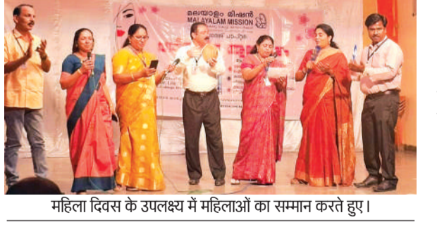
महिला दिवस के उपलक्ष्य में महिलाओं का सम्मान करते हुए।