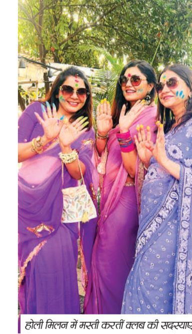
होली मिलन में मस्ती करतीं क्लब की सदस्यिकां।