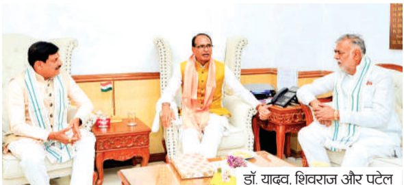
डॉ. यादव, शिवराज और पटेल

इस अवसर पर प्रदेश के पंचायत एवं ग्रामीण विकास मंत्री प्रह्लाद सिंह पटेल और वरिष्ठ अधिकारी भी उपस्थित रहे। इस उच्च स्तरीय चर्चा में ग्रामीण सड़कों सहित अनेक विषयों पर मध्यप्रदेश को बड़ी राहत देने वाले निर्णय लिए गए। चौहान ने भावांतर भुगतान योजना के तहत संबंधित विभागों को भुगतान प्रक्रिया तेजी से पूरा