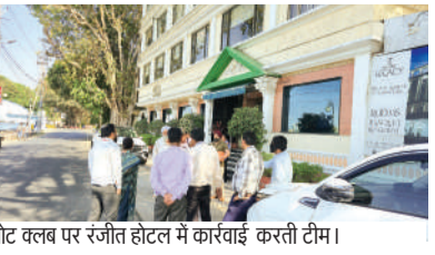
बोट क्लब पर रंजीत होटल में कार्रवाई करती टीम।

बड़े तालाब को बचाने के लिए सीमांकन का काम जारी है। टीटी नगर एसडीएम की टीम ने वन विहार के पास से सर्वे शुरु किया, जिसकी शुरुआत में नगर निगम द्वारा लॉज पर दिए गए जॉक रेस्टोरेंट पर लाल निशान लगाया गया है। रेस्टोरेंट का चार हजार वर्गफुट एरिया पचास मीटर के दायरे में आया है। इसके साथ लहर रेस्टोरेंट, विंड्स एंड वेब, होटल रंजीत लेक व्यू का निर्माण पचास मीटर के दायरे में किया गया है। टीम ने बोट क्लब की बाउंड्री को एफटीएल मानते हुए सर्वे किया है। इधर नगर निगम के फूड जोन में बनी 26 दुकानें भी पचास मीटर की जट में आई हैं।