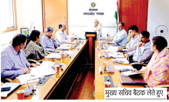
मुख्य सचिव बैठक लेते हुए

उन्होंने बताया कि पश्चिम एशिया में भू-राजनीतिक गतिविधियों के कारण पेट्रोलियम और प्राकृतिक गैस की आपूर्ति व्यवस्था पर विशेष ध्यान दिया जा रहा है। अब तक अधिकांश कच्चे तेल की आपूर्ति स्टेट ऑफ होर्मुज के रास्ते होती थी, लेकिन वर्तमान परिस्थितियों में अन्य स्रोतों से भी कच्चे तेल की आपूर्ति सुनिश्चित की गई है। देश की रिफाइनरियां उच्च क्षमता पर कार्य कर रही हैं और एलपीजी उत्पादन बढ़ाने के निर्देश दिए गए हैं। इसके परिणामस्वरूप एलपीजी उत्पादन में लगभग 25 प्रतिशत की वृद्धि हुई है। मुख्यमंत्री ने कहा कि एक महत्वपूर्ण राजनीतिक उपलब्धि यह भी है कि स्टेट ऑफ होर्मुज से गुजरने वाले भारतीय ध्वज वाले जहाजों और टैंकरों को नहीं रोका जाएगा, जिससे पेट्रोलियम आपूर्ति में किसी प्रकार की बाधा नहीं आएगी। प्राकृतिक गैस की आपूर्ति के लिए वैकल्पिक आपूर्तिकर्ताओं के माध्यम से खरीद प्रक्रिया जारी है और घरेलू पाइपलाइन गैस तथा वाहन गैस की आपूर्ति बिना कटौती के जारी है। प्रदेश में पेट्रोल, डीजल, एटीएफ, कच्चा तेल और घरेलू गैस की किसी प्रकार की कमी नहीं है तथा आपूर्ति लगातार जारी है। पेट्रोलियम पदार्थों की कीमतों में भी किसी प्रकार की वृद्धि नहीं हुई है। इस विषय की निगरानी के लिए वरिष्ठ मंत्रियों की एक समिति का गठन भी किया गया है।