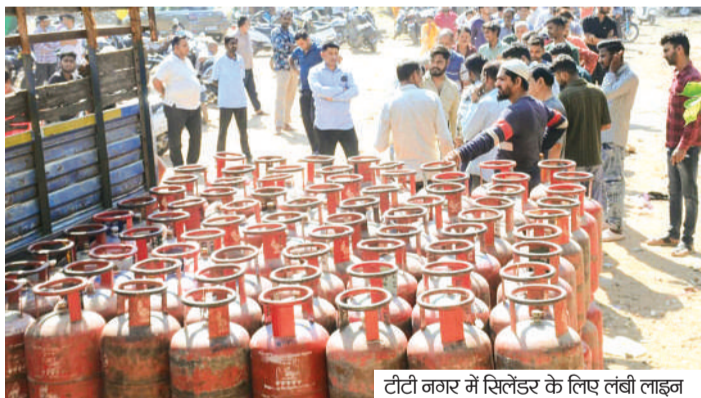
टीटी नगर में सिलेंडर के लिए लंबी लाइन