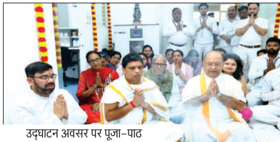
उद्घाटन अवसर पर पूजा-पाठ

भारतीय ज्ञान परंपरा और आधुनिक विज्ञान के समन्वय के उद्देश्य से कार्यरत पंतजलि अनुसंधान संस्थान द्वारा आज एक महत्वपूर्ण वैज्ञानिक उपलब्धि प्राप्त करते हुए अत्याधुनिक जेब्राफ्रिशा और ड्रोसोफिला अनुसंधान प्रयोगशाला का औपचारिक उद्घाटन, संस्थान के मार्गदर्शक, ध्वंस्तरि स्वरूप, आयुर्वेद को विश्व पटल पर स्थापित करने वाले प्रतिष्ठित वैज्ञानिक आचार्य बालकृष्ण द्वारा किया गया। इस अवसर पर संस्थान के वरिष्ठ वैज्ञानिकों, शोधकर्ताओं तथा विभिन्न विभागों के प्रतिनिधियों की उपस्थिति में इस उपलब्धि को और भी विशेष बना दिया। यह जेब्राफ्रिशा और