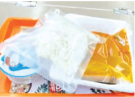
वंदेभारत एक्सप्रेस के इस पैकेट में रोटी की जगह चावल दिए गए हैं।