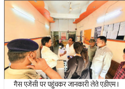
गैस एजेंसी पर पहुंचकर जानकारी लेते एडीएम।