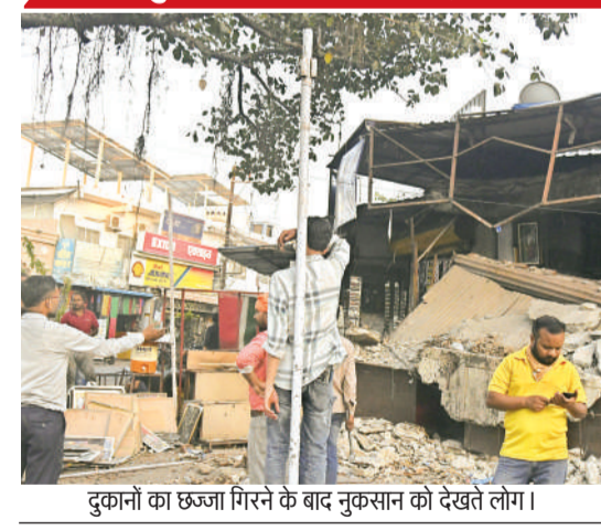
दुकानों का छज्जा गिरने के बाद नुकसान को देखते लोग।

दुकानदारों का आरोप है कि दुकानों के ठीक सामने मुख्य सड़क पर मेट्रो प्रोजेक्ट का निर्माण चल रहा है। रात के समय झिल्लिंग से कंपन होता है। दुकानदारों का मानना है कि कंपन की वजह से दुकानों की नींव और छज्जे कमजोर हो गए थे, जो गुरुवार को ढह गए।