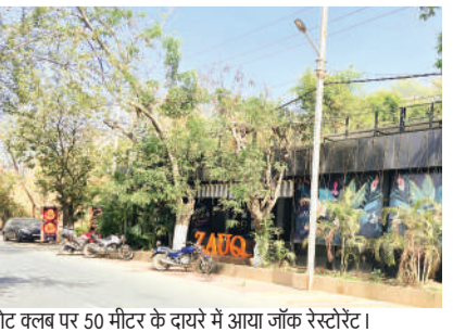
बोट क्लब पर 50 मीटर के दायरे में आया जॉक रेस्टोरेंट।

टीम ने एफटीएल के पचास मीटर सर्वे में बोट क्लब के सामने बने गेम जोन, कचरा कैफे, सुलभ कान्पलेक्स, लहर जिम, मध्यप्रदेश टूरिज्म बोर्ड के रेस्टोरेंट को अतिक्रमण में दर्ज किया है। इसके साथ तालाब के एफटीएल पर रेस्टोरेंट का निर्माण भी किया गया है।