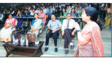
वाणिज्य प्रतिनिधि | भोपाल