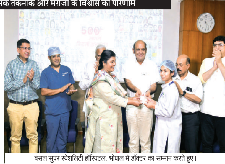
बंसल सुपर स्पेशलिटी हॉस्पिटल, भोपाल में डॉक्टर का सम्मान करते हुए।